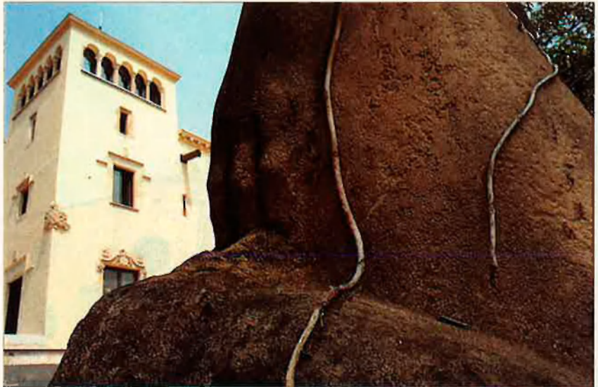
Fa poc, el palau s'esfondrava. Ara, els alumnes d'Eina hi trobaran un espai preciós.

Un jardí ha de ser un espai de vida amable, certament, i no cap decoració versallesca; un lloc on les plantes i les persones troben el racó just on poder créixer i desenvolupar les pròpies formes, o idees, d'una manera el més espontània i vigorosa possible. Un jardí per a mi cal que siga una imatge humanitzada del paradís, un lloc on faça goig estar en totes les estacions de l'any i no un exòtic lloc de pas ni menys en-