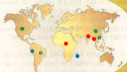
Casos declarats el 1992 (Total 1.582)