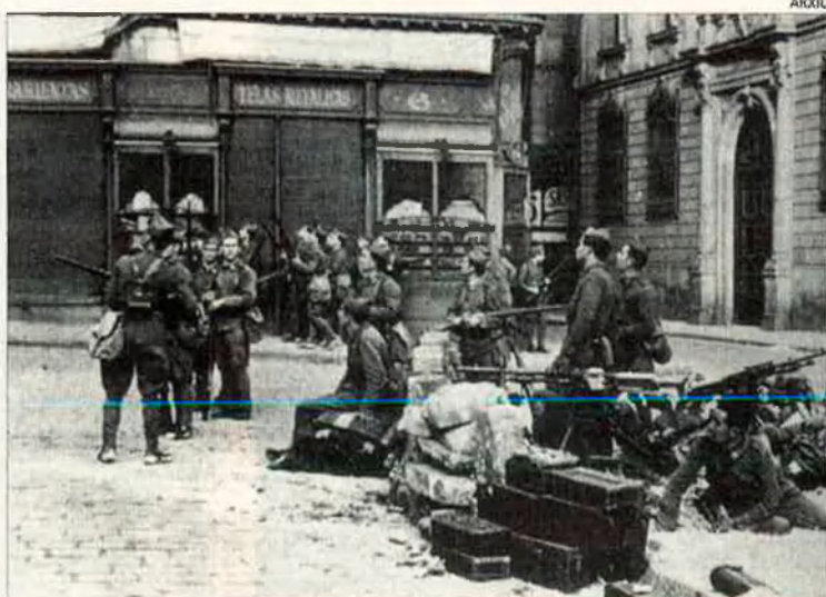
Imatge de les metralladores situades a la plaça de Sant Jaume -aleshores, de la República- el matí del dia 7. Generalitat i Ajuntament ja s'havien rendit.

A partir dels Fets d'Octubre, el Govern de la República començà a reduir l'autonomia de Catalunya. D'octubre a febrer del 1935 el govern i les Corts d'Espanya van confiscar el servei de recaptació de les contribucions i la gestió de