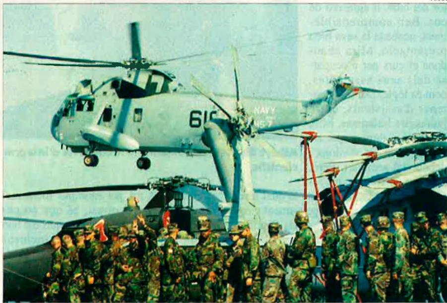
Els soldats nord-americans ja són a Haití. El president Clinton, però, ha pagat un preu molt alt per aquesta operació.

Aquestes són dues mostres només del munt de despropòsits que ha acumulat en pocs dies Bill Clinton, com a comandant