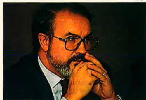
Pere Solbes. Ministre d'Economia.

Les dades econòmiques aparegudes les darreres setmanes, que indiquen l'inici d'una represa de l'economia, han facilitat també l'acord. CiU ha posat èmfasi en recordar la seua responsabilitat en matèria econòmica i en aclarir que els acords sobre pressupostos són beneficiosos per a tots, perquè aporten estabilitat.