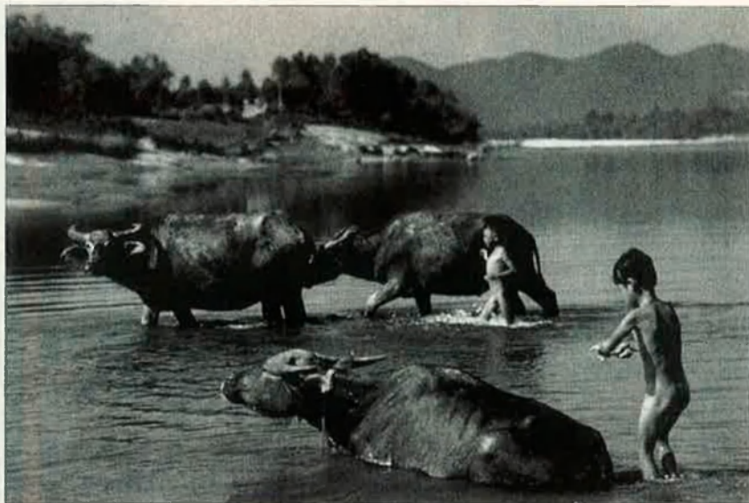
Dos nens banyen unes vaques en el riu dels Perfums a Vietnam.

Durant aquestes vetllades també s'han atorgat els Visa d'Or Arthus Bertrand als millors reportatges de l'any, escollits per un jurat format per directors de fotografia de diaris i revistes de tot el món. Així el Visa d'Or, Premsa Diària, ha estat acordat a Pat Beck ( Detroit Free Press ), per un reportatge sobre uns infants malalts del ter-