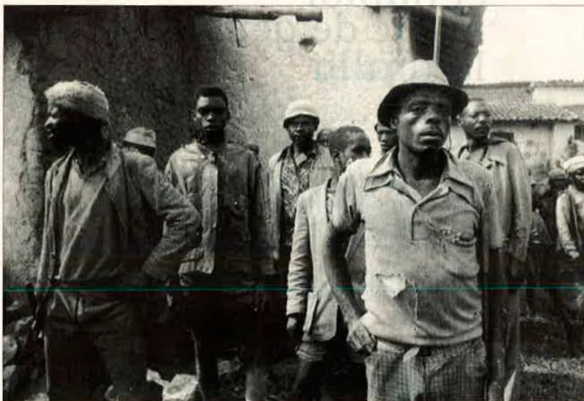
Grup de hutus responsable de les execucions massives de tutsis a Ruanda.

És innegable el valor periodístic immediat que