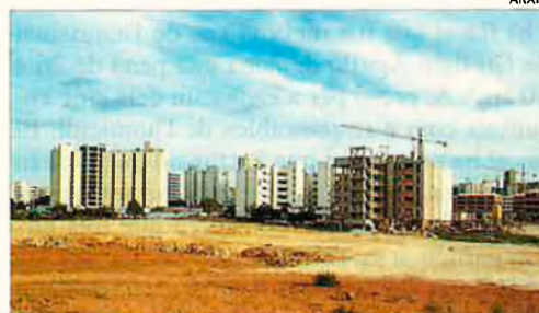
El GOB denuncia la gestió del Govern Balear. Les actuacions afecten pinar i garriga.

El GOB ha denunciat que el Govern Balear tramita 23 projectes urbanístics a Mallorca. Aquests projectes ocuparan quasi 1.500 hectàrees, incrementaran l'oferta hotelera en 30.000 places i motivaran l'aparició de 12 nous camps de golf. Aquestes urbanitzacions es construïran al litoral i a l'interior de municipis costaners "a zones de pinar i garriga que, incomprensiblement, foren excloses de la protecció que els havia concedit inicialment la Llei d'Espais Naturals", segons l'organització ecologista.