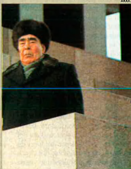
Leonid Brèjnev. La màfia va créixer sota el recer del seu mandat.

Els 700 padrins. Últimament, enmig de la nebulosa mafiosa, comencen a di-