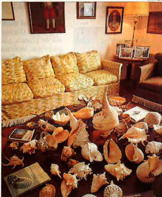
La sala de les Caragoles. Un altre tresor.

durant un any i sis dies. El director de la penitenciària, en ser alliberat en acabar la guerra, es va justificar: