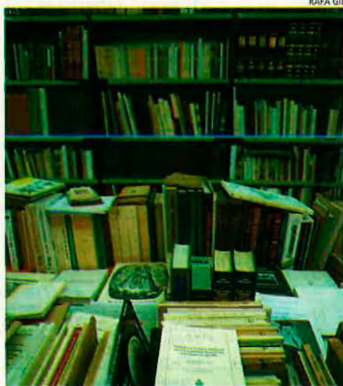
Els llibres que ens estalviarem.

"Ara que es parla d'una substitució a les conselleries de Cultura i de Governació, també és parla d'una iniciativa de diversos lobbies de contribuents catalans per aconseguir que alguns escriptors rebin una beca de la Generalitat amb la condició de no escriure."