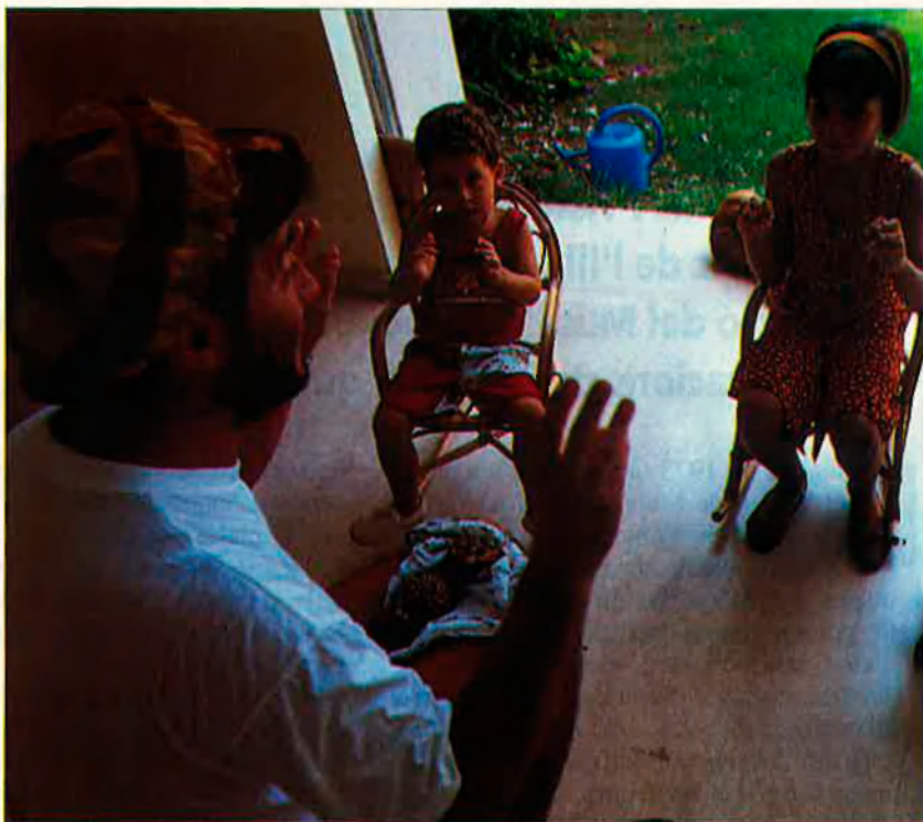
Segons Giménez, l'escola hauria de recuperar la cultura popular. La quitxalla en sortiria beneficiada sens dubte.