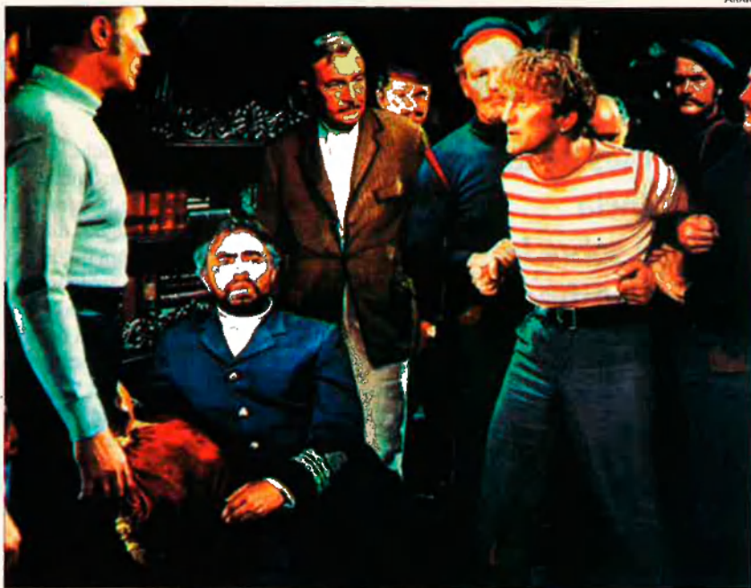
Fotogrames de les pel·lícules '20.000 leguas de viaje submarino' (dalt) i 'La volta al món en 80 dies' (baix). Algunes de les obres més famoses de Verne han estat trasladades a les pantalles de cine.

L'error no és de Verne. Els errors profètics poden explicar-se en una frase d'aquest mateix llibre. El narrador diu que els invents es basen en principis científics perfectament coneguts al segle XIX, dels quals, tanmateix, no se n'havia tret cap profit. I tots sabem que Verne va morir abans que molts d'aquests principis fossin coneguts. Per això, les seves profecies tenen tantes limitacions.