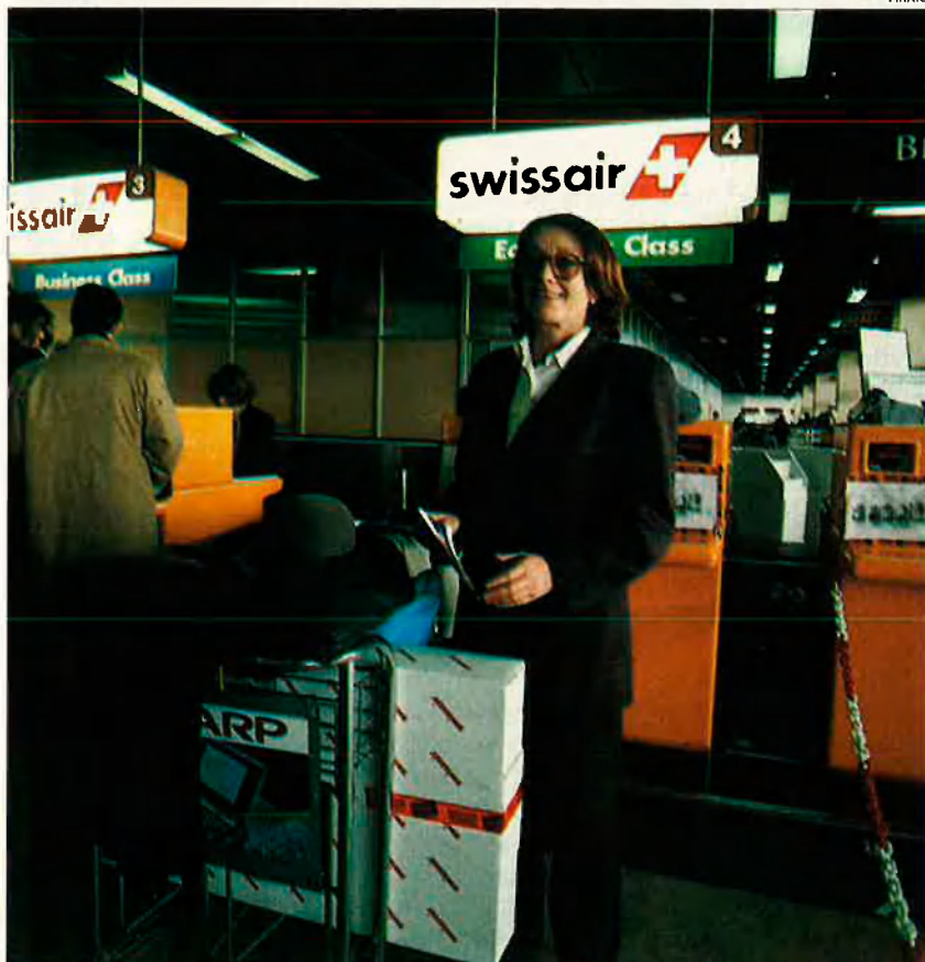
Rosa Regàs. L'escriptora, que ha guanyat l'últim Premi Nadal amb la novel·la Azul , assegura als seixanta anys que "com més vius, millor escrius".