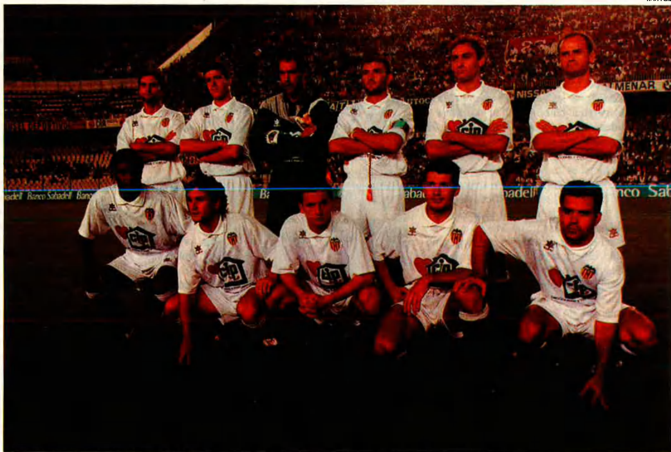
El València s'ha renovat molt per afrontar amb garanties aquesta temporada. Ara aspira al títol de Lliga.