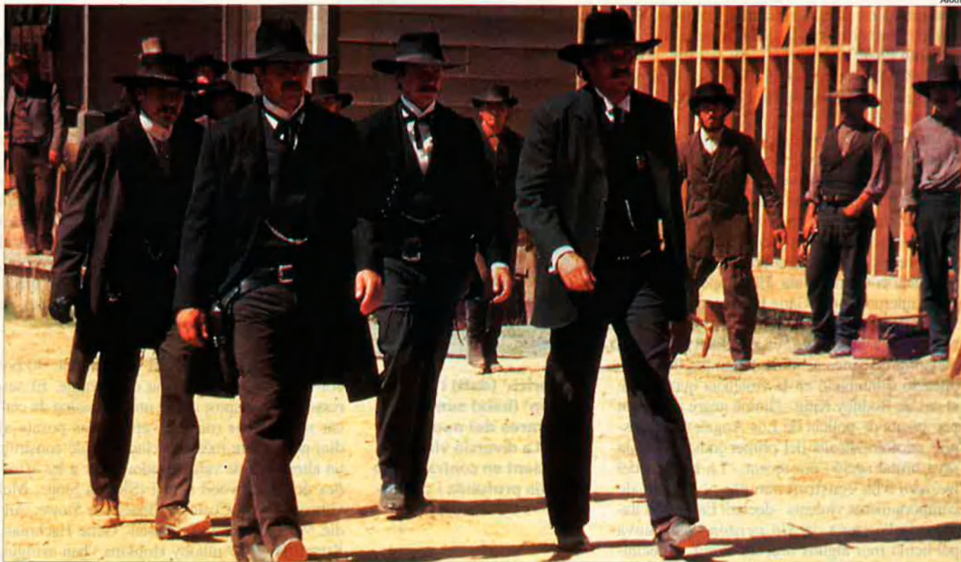
'Wyatt Earp'. Kevin Costner ha rendibilitzat la fascinació pels relats de l'Oest gràcies a aquest film.