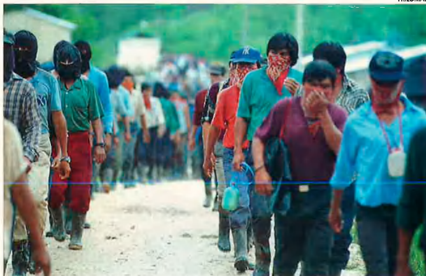
L'EZLN a Guadalupe. Els zapatistes compten amb la simpatia d'un important sector de la societat mexicana per les seves reivindicacions socials.