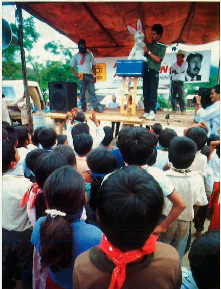
Un altre aspecte dels actes del PRD a Guadalupe. La imatge dels jocs infantils no pot amagar les agressions que pateixen els militants del PRD.