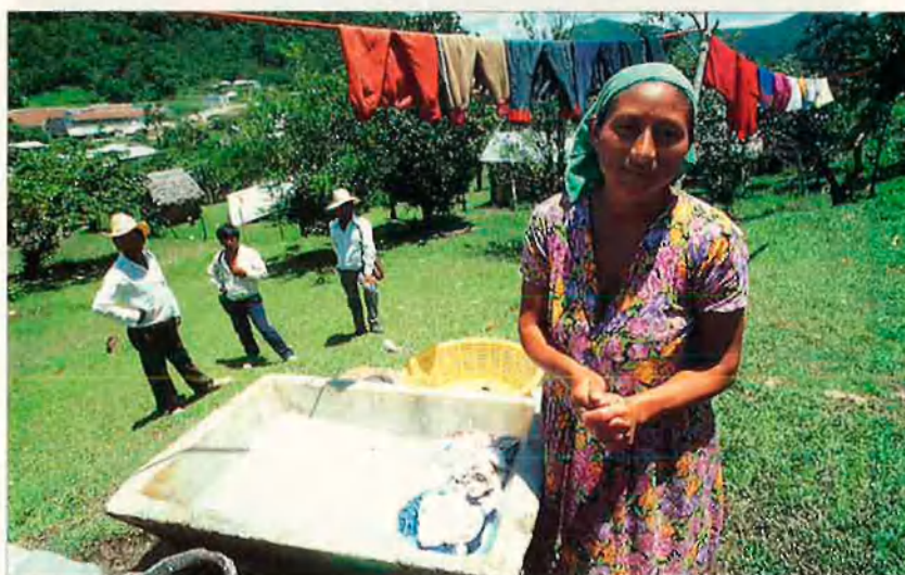
Els indígenes formen el teló de fons de l'actual panorama polític mexicà. La revolta de cap d'any es va originar en els seus territoris.