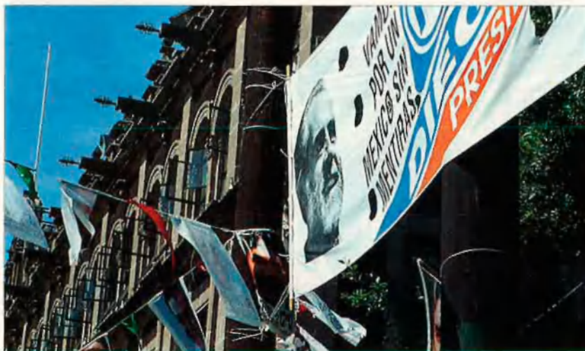
Cartell electoral a Cuernavaca. El vot de la societat civil és objecte de desig de tots els candidats de l'oposició.

al panorama pre-electoral mexicà. La proposta d'un govern de transició, com a alternativa al resultat electoral i la reforma de la Constitució, constitueixen els únics eixos comuns d'aquesta denominada societat civil que es divideix davant qüestions tan importants com l'acceptació democràtica del resultat electoral del 21 d'agost i la negativa absoluta o relativa de fons sobre una opció violenta com a instrument per al canvi definitiu democràtic de la nació. I finalment hi ha els insurgents, l'anomenat Exèrcit Zapatista d'Alliberament Nacional, que lidera el subcomandant Marcos i que constitueix la veu amenaçadora del panorama social, econòmic i polític de la República Federal de Mèxic. Aquesta guerrilla armada de "nou encuny" va commoure la societat mexicana quan, en la matinada del 31 de desembre de 1993, va ocupar quatre municipis de l'Estat de Chiapas, al sud-est de Mèxic, va reclamar mesures socials per als camperols indígenes que l'habiten i va plantejar una alternativa de terra, justícia i llibertat que va atorgar una dimensió nacional al que semblava, exclusivament, un conflicte regional de misèria i injustícia social.