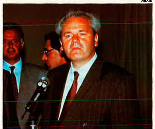
Milosevic. Ara es desmarca de Karadzic.

•El pla de pau atorga als serbis de Bòsnia el 49% del territori, mentre que ara en controlen militarment el 70%.