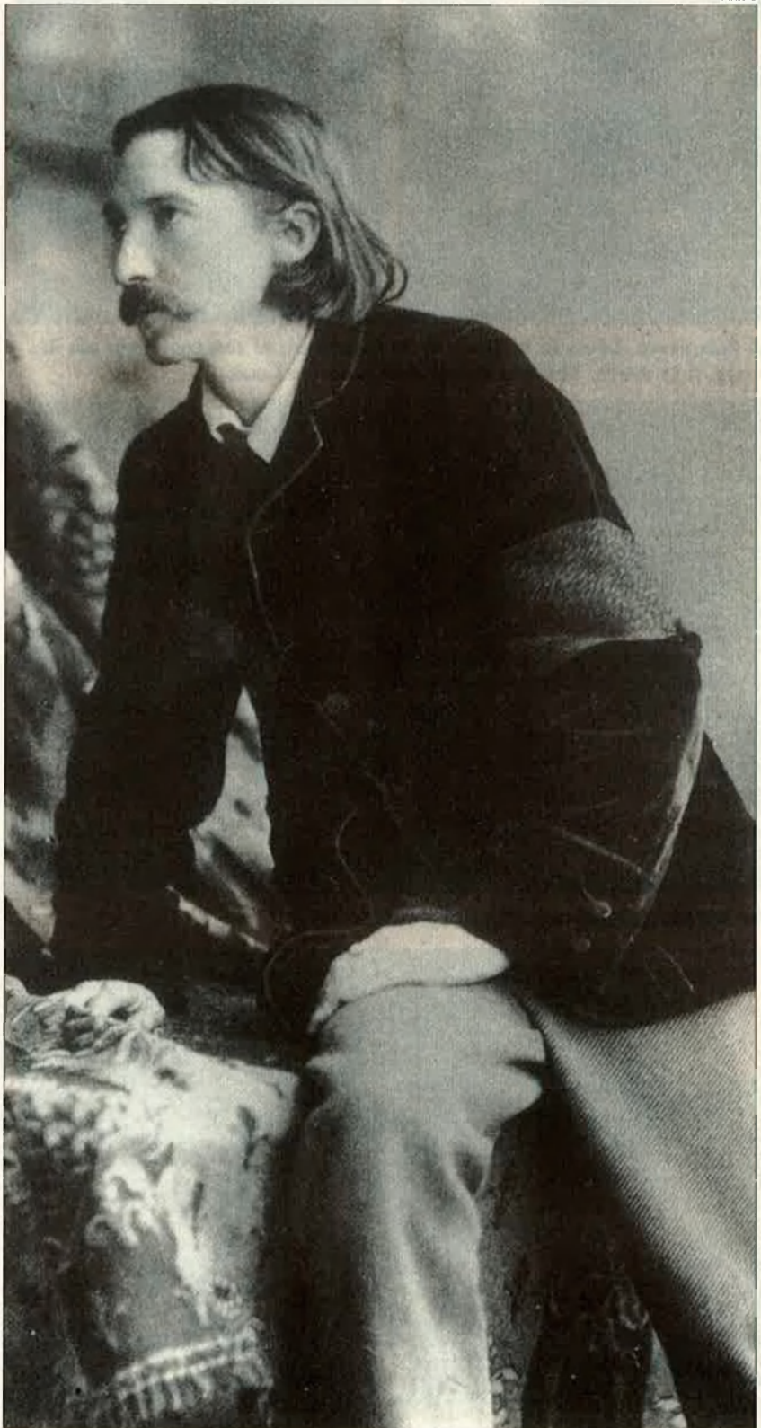
R.L. Stevenson retratat per Hawker of Bournemouth.