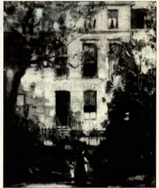
A l'esquerra, la fonda Siron, a Barbizon, l'any 1870. A la dreta, Heriot Row.

Van salpar el juny del 1888 i de seguida es van adonar que aquell era un viatge sense retorn. Seguint les passes del seu admirat Herman Melville (el de Moby Dick ), RLS va voler conèixer l'illa que havia inspirat Typee i, després d'una estada a Hawaï (n'hi ha fotos impagables amb el rei Kalakau), van acabar fixant residència a l'illa de Samoa, on, com passa en alguns contes, RLS va ser feliç, es va convertir en "Tusitala" i encara avui exerceix de reclam de turistes il·lustrats.