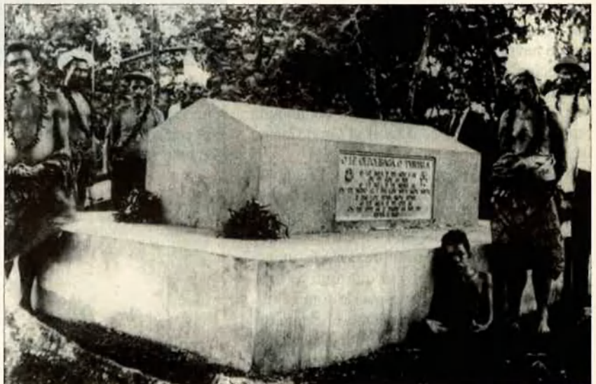
Tomba de R.L. Stevenson a Mont Vaea (Samoa).