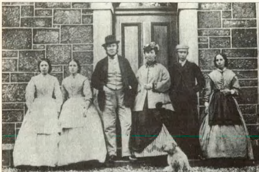
La família Stevenson, amb dues minyones.