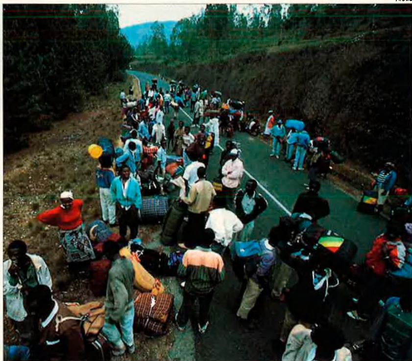
Ruandesos fugint. Un desplaçament tan massiu i sobtat de la població és un fenomen típicament arcaic.

Àfrica té un nombre desproporcionat de fronteres. Per a un total de 680 milions de persones hi ha 53 fronteres. En canvi a l'Àsia per a tres mil milions de persones només hi ha 33 fronteres i Europa en té 33 també per a 794 milions de persones. Aquesta divisió política i territorial d'Àfrica, el que se'n diu la seua "balcanització", és sovint considerada com una de les causes majors de les greus dificultats econòmiques i socials del continent. La situació és especialment difícil a l'Àfrica al sud del Sàhara, que compta amb les tres quartes parts de la població i 45 estats. De fet quan es parla de l'Àfrica cal fer la distinció entre l'Àfrica negra i l'àrab. Perquè les seues problemàtiques són molt distintes, com enormement distintes són les seues bases culturals i econòmiques.