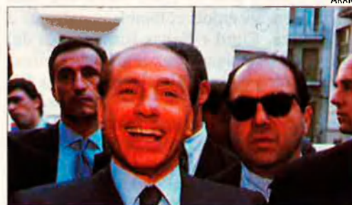
L'ordre de detenció del seu germà ha creat greus dificultats a Berlusconi.

El Govern italià ha deixat la Unió en estat de xoc després d'anunciar que pensa obstruir tant com pugua el Capítol Social del Tractat de Maastricht. Amb això Silvio Berlusconi s'alia amb els conservadors britànics, els únics que s'havien oposat fins ara a aquest apartat, que de fet el regne Unit no va signar en el seu moment. La resta d'estats de la Unió han expressat la seua consternació per l'actitud italiana perquè dificultarà enormement l'aplicació d'aquest apartat del Tractat de la Unió Europea.