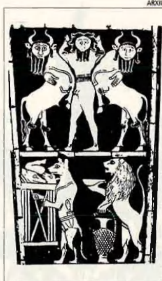
Dimoni en forma d'animal. Panel incrustat en arpa rei de Ur (sobre 2800 a. c.)

Les civilitzacions de l'Àsia Central i la conca de l'Eufrates, l'antiga Mesopotàmia per on es va estendre l'imperi babilònic, posseeixen una rica tradició d'àngels i dimonis que influirà posteriorment la demonologia judaica tardana i la cristiana. L'antiga mitologia de l'Iran, representada fonamentalment per Zaratustra, estableix un dualisme entre la divinitat benèfica Ahura Mazda i el seu germà bessó Ahriman, que representa les forces del mal. Aquesta oposició es retrobarà després transformada en l'enfrontament fratricida entre Caïm i Abel. En l'antic Egipte, la lluita entre les divinitats positives i negatives és representada pel duel entre els germans Osiris i Set. Déu de la guerra i les tempestes, Set és representat generalment amb un cap d'ocell. Algunes altres cultures asiàtiques, com ara l'índia, la tibetana o la xinesa, també tenen un ampli repertori de figures diabòliques, però algunes d'aquestes divinitats tenen adesiara una naturalesa mixta, en què poden coexistir perfectament el bé i el mal.