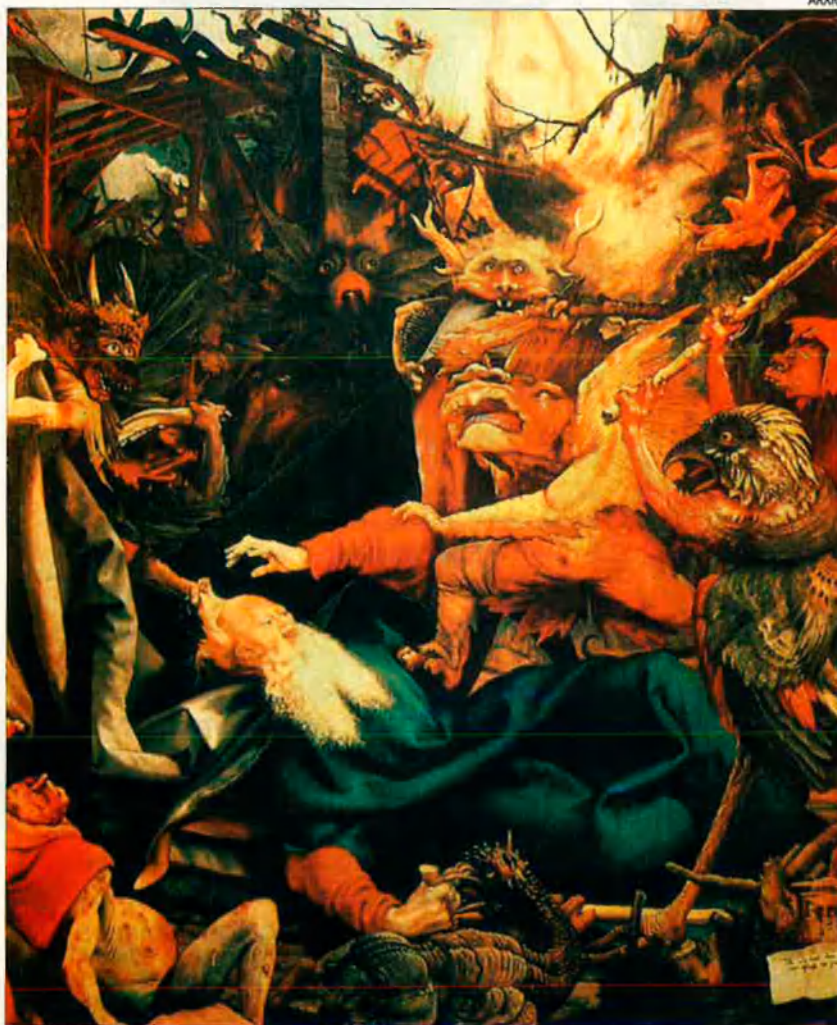
"Las tentaciones de San Antonio" de Mathias Grünewald. Els diables acosan al sant.

Les divinitats agrícoles de l'antiga Grècia, amb les aportacions pròpies d'etruscs i romans, han contribuït a configurar la representació cristiana del dimoni. La desmesurada sexualitat i l'esperit irascible de Satanàs, més la seua peculiar anatomia bestial i humana, tenen l'origen en certes divinitats inferiors, tals Pan, els sàtirs, els faunes i els silens. La concepció cristiana de l'infern també es troba molt vinculada al món dels morts de la cultura greco-romana, en què Hades és el senyor de las tenebres.