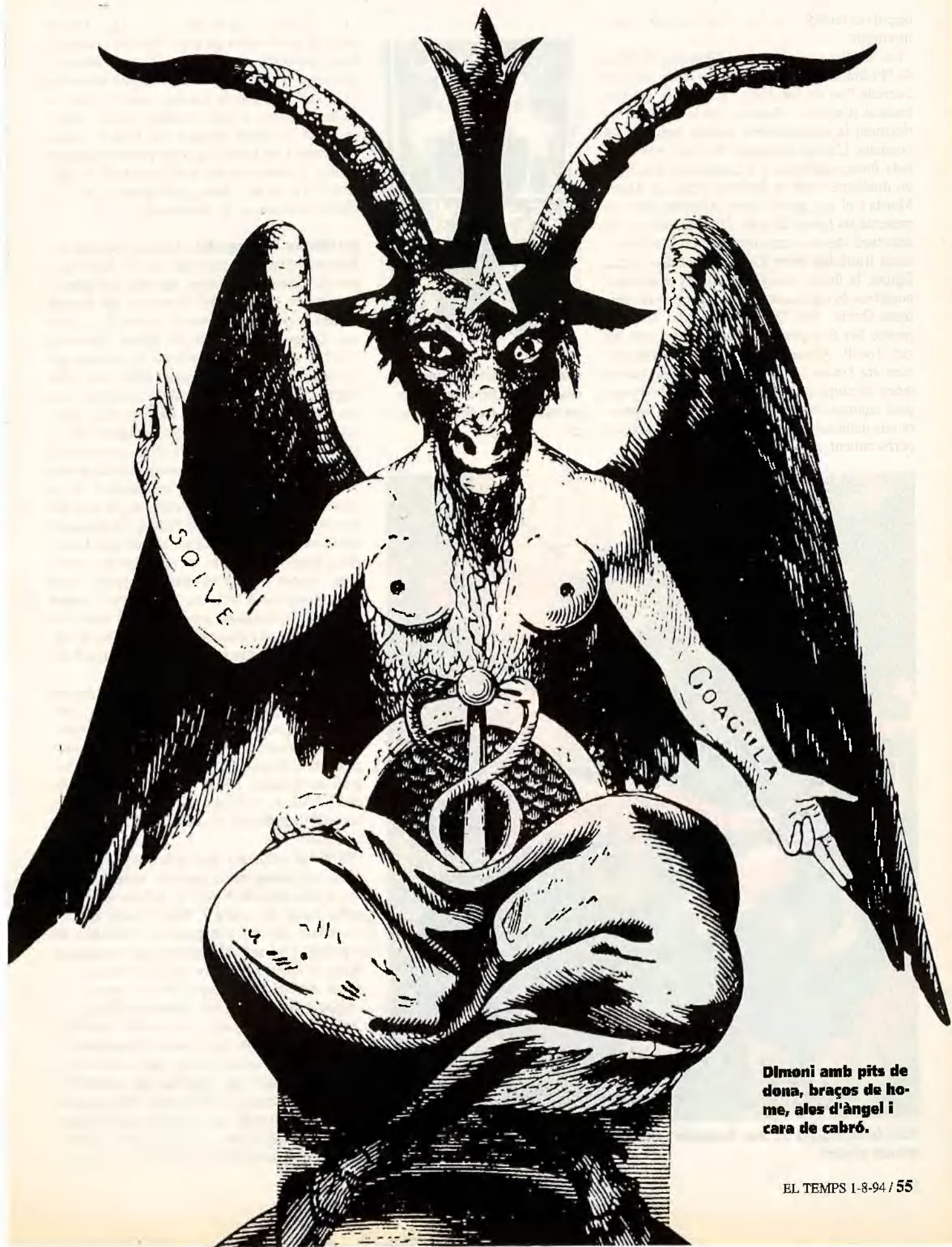
Dimoni amb pits de dona, braços de home, ales d'àngel i cara de cabró.