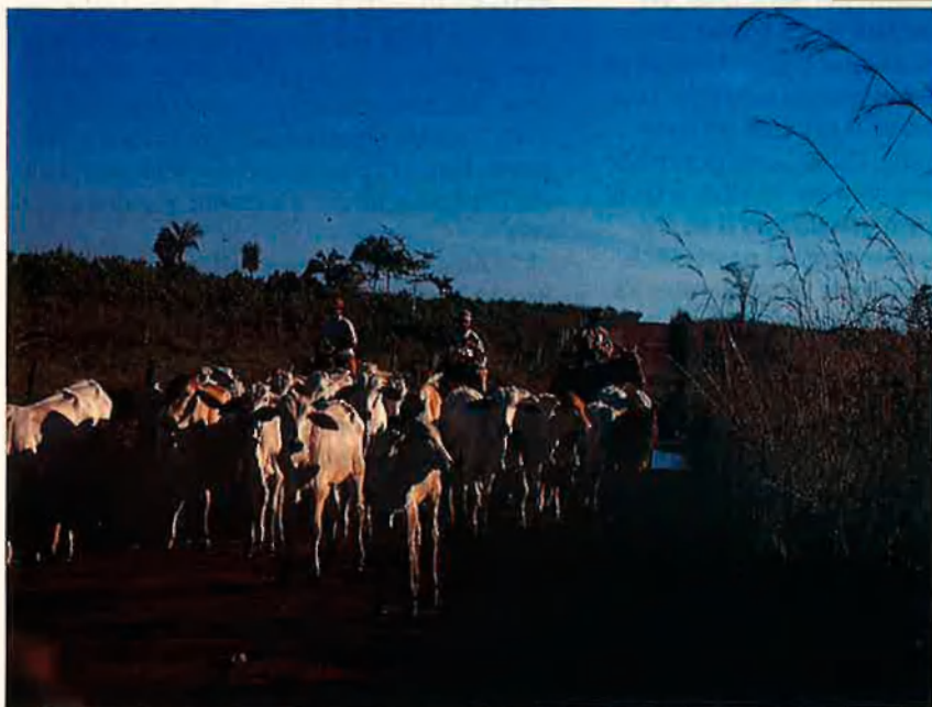
Les vaques han substituït la selva. La ramaderia és l'única solució a curt termini per a una terra poc productiva sota l'agricultura intensiva.

questa mà d'obra esclava es dedica a la deforestació de la selva. Enguany amb falses promeses, els treballadors arriben a fazendas aïllades on no coneixen ningú, a vegades a més de 1.000 km. de distància de la seva casa, i allí són obligats a comprar tot el que necessiten, en magatzems regentats pel gato , l'home que els contractà, a preus exagerats. Es crea així l'esclavitud per deutes, definida per l'OIT, com a mà d'obra esclava. Per molt que treballen, els que han caigut en el parany no podran pagar els deutes mai o, com a molt, cobraran una misèria".