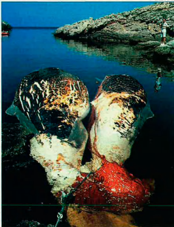
Cadàvers de catxalots a les costes balears. Milers de cetacis moren enredats a les xarxes de deriva. En només 2 mesos ja han aparegut vuit catxalots a les costes de les Illes.

La lluita contra la matança. Ara fa deu anys Greenpeace començà la campanya contra les xarxes de deriva. Anualment l'organització ecologista transmet a diversos organismes internacionals, especialment l'ONU, informes en què demana la prohibició d'aquesta art pesquera. Diversos països (EUA, Austràlia, Canadà, Nova Zelanda...) prohibiren aquesta tècnica. Posteriorment l'ONU, l'any 1992, va decretar una moratòria mundial sobre l'ús de les xarxes de deriva en aigües internacionals. La comunitat europea, el mateix