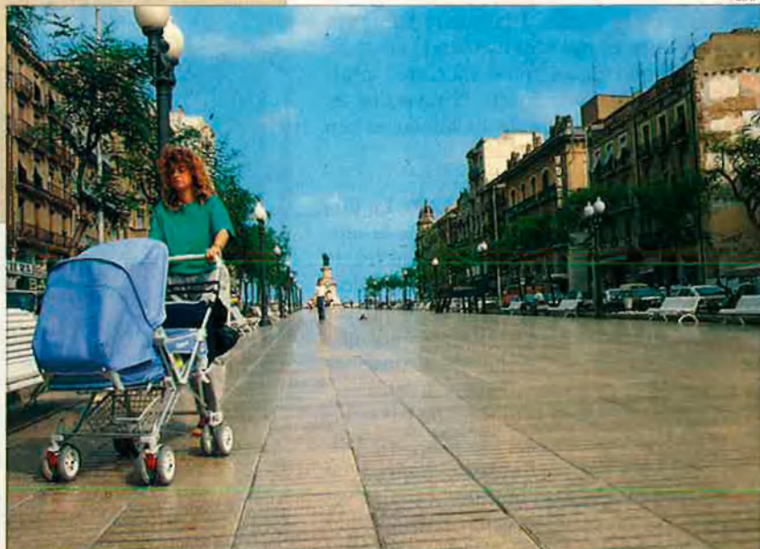
La rambla nova de Tarragona. Aquesta ciutat ha estat durant molt de temps una ciutat amb demografia d'al·luvió.