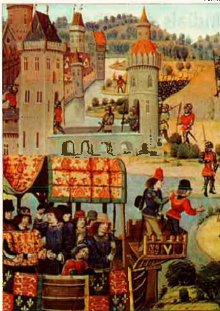
El 1000 va ser un moment de canvi. Ho serà també el 2000?

Tot això va promoure un creixement de les ciutats, uns canvis tècnics i unes millores en els transports. Els comerciants necessitaren molts més espais per guardar les seves mercaderies que no el que les