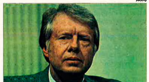
Jimmy Carter. L'ex-president nord-americà ha acostat els diversos interlocutors.