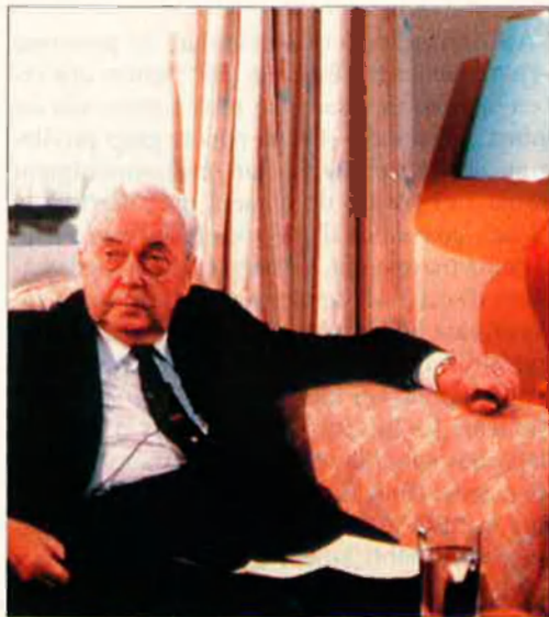
Harold Wilson. El ministre laborista va dimetir perquè els serveis secrets el vetaren.

Els "autors" del manteniment dels secrets d'estat no són pas els ministres, sinó l'exèrcit professional de carrera de l'alt funcionariat. Secretaris i presidents de les comissions ministerials són els únics que coneixen el funcionament exacte de l'aparell estatal.