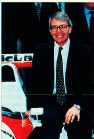
John Major. Els serveis secrets del Regne Unit estenen la seva influència arreu del món.

Els ministres passen i els serveis secrets queden. En els estats democràtics occidentals, els centres d'intel·ligència desenvolupen els seus propis mecanismes d'autodefensa.