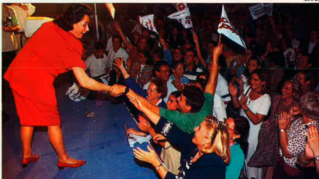
Rita Barberá, l'alcaldessa de València, eufòrica. Els simpatitzants del PP van viure la seua nit en saber-se els resultats de les europees.

El Partit Popular va ser el més votat en el conjunt dels Països Catalans. A les Balears, superà per primer cop el 50% dels sufragis (el votà un de cada dos illencs). Al País Valencià (44%), uns resultats com aquests permetrien als populars dominar les principals institucions. Al Principat (18%) és on el PP ha pujat menys respecte a l'any passat, però si els comparem amb els de fa tres anys, els nivells actuals són altíssims.