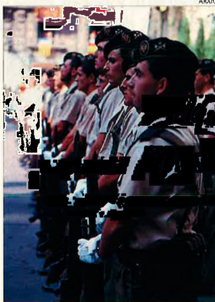
La lleva. L'exèrcit és ple d'amateurs.

La caiguda de l'imperi soviètic i altres falles adjacents els va estalviar –als bolxevics, és clar– el maldecap i el saine de declarar-nos la guerra a aquesta banda d'occident. Per tant, fora d'ajudar a apagar els incendis forestals –i ja que ens hi referim, res millor que es professionalitzen–, seria algú tan amable d'aclarir per a què cony aprofita un exèrcit d' Hazanas Bèlicas , si tampoc no hi ha ganes de fer-se amb Groenlàndia, on diuen que hi ha bon bacallà i la gent és neta i noble, culta, rica, lliure, desvetllada i feliç? Al Ministeri de la Guerra –l'anomenen de Defensa, no sé per què– no li quadren els números. Diuen que hi ha massa objectors, excés d'insubmisos i, en conjunt, un notable contingent que li tira molta cara a l'assumpte per tal