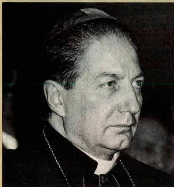
Carlo Maria Martini.