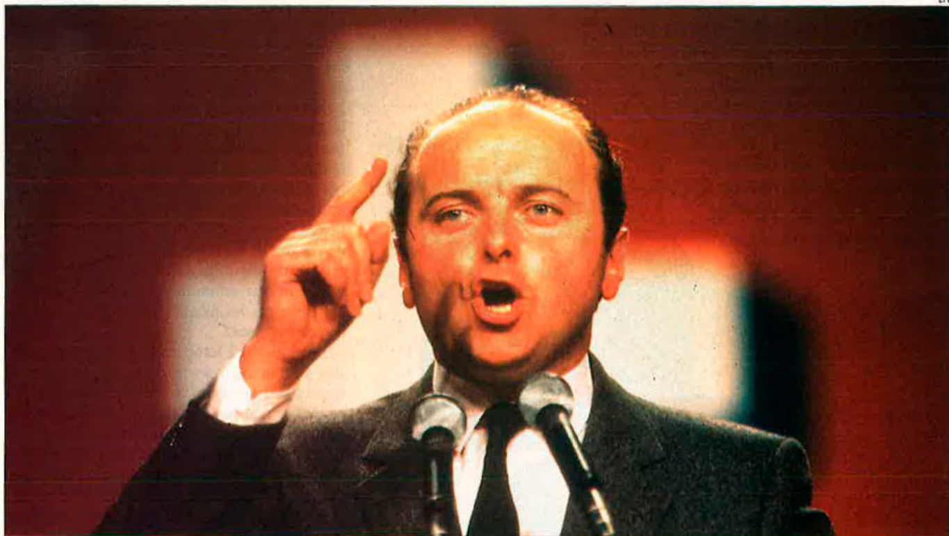
Jacques Toubon. El ministre de Cultura lamenta el fet que l'estat francès no consagri una part considerable del pressupost general a la difusió de la llengua francesa.