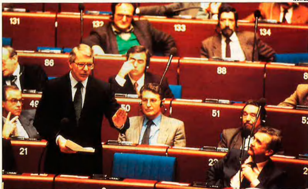
La impopularitat dels conservadors britànics desequilibra la balança.