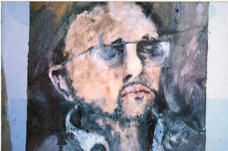
Dalt, una fotografia d'Evgen Bavcar, el fotògraf de Barceló. Baix, un retrat d'Evgen Bavcar fet per l'artista de Felanitx.

de percebre no pas amb la mirada, sinó amb el cos sencer. El gest de Barceló en la pintura esdevé més material per la substància de l'escultura. No es pot tocar el color, però sí la forma. A través de l'escultura veig el seu gest de pintor.