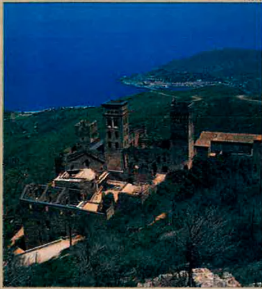
Monestir de Sant Pere de Roda, a l'Empordà. Els vestigis de l'any 1000 són escassos.

la subversió de la natura, l'obtenció de pocions màgiques o fins i tot la recreació de nous éssers. Hi hauria avui alguna imatge que ens recordés aquesta subversió de la natura? Probablement, la nova biologia molecular pot fer aquesta funció. Avui, l'home manipula la natura. Però no ja amb secrets rituals, sinó amb mètodes científics a la vista de tots. No deixen de ser elements esotèrics, és a dir, per a iniciats. Però ja no s'amaguen darrere secrets seculars.