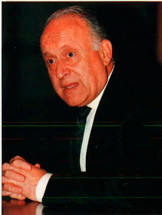
Xabier Arzallus. El Partit Nacionalista Basc tampoc se n'ha sortit.

L'escàndol protagonitzat per Mariano Rubio ha entorbidat la imatge del Banc d'Espanya. I possiblement ha dificultat la negociació sobre canvis autonòmics en la institució.