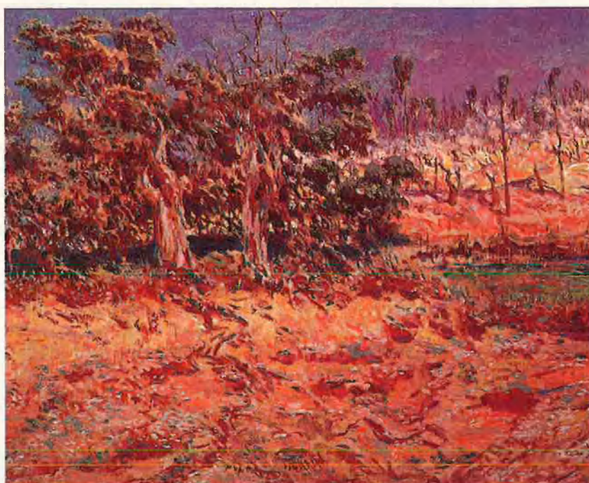
Dalt, 'Laporotomia' (1898), Vicent Castell. Baix, 'Barranc de Jericó' (1901), Antonio Muñoz Degrain.

U n segle de pintura valenciana, 1880-1980. Intuïcions i propostes." El títol no deixa de sorprendre per l'amplitud dels seus límits. O per la dificultat que representa vertebrar en un mateix espai expositiu la història, controvertida, de la plàstica valenciana de cap a cap de segle: l'un, volent anar més enllà de les arbitriietats acadèmiques, d'una estètica obsoleta, a la recerca de solucions renovadores. El segon, buscant de defugir, en la individualització de l'artista, en el seu quefer particular i íntim, el desmembrament del panorama pictòric. I entre aquestes dues fites es debaten els canvis més radicals