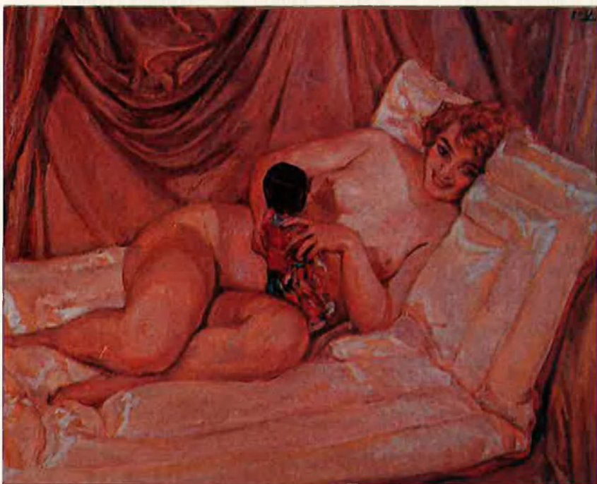
Dalt, 'La Cocaina', Daniel Sabater. Baix, 'Desnudo rosa' (1924), Fernando Viscaí.

que la pintura ha viscut al llarg de la seua història. De les propostes avantguardistes més agosarades a les expressions més provocadores del pop-art , qualsevol tendència del nostre segle ha deixat la seua empremta en la realitat artística valenciana. Una realitat, tanmateix, que ha estat determinada pel tamís circumstancial particular, ben diferent, per altra banda, del de la resta d'Europa. La simultaneïtat dels fenòmens es fa difícil a aquesta banda dels Pirineus perquè, entre altres raons, sobre el cas valencià pesa la mancança informativa de l'actualitat artística europea i, especialment, la presència d'una societat rural i conservadora; o l'absència, més aviat, d'una burgesia renovadora i emprenedora.