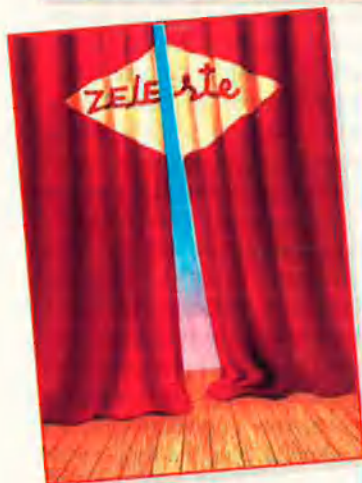
La sala Zelestes i els cuplets 'camp' de la Motta.