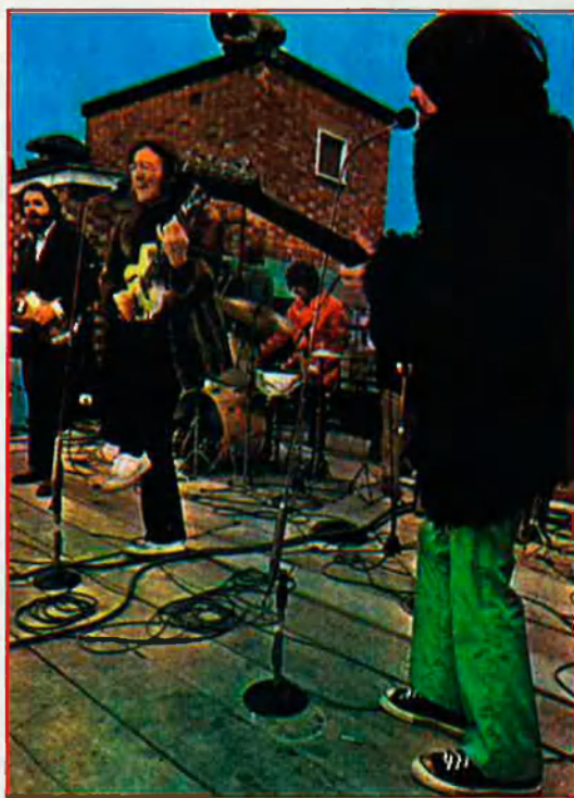
El "The end" dels Beatles amb "Get back".