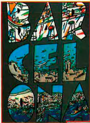
Mariscal i Barcelona. Marlon Brando i el film escàndol dels 70, 'L'últim tango a París', Johan Cruyff i l'humor de Jaume Perich, Perich Match.