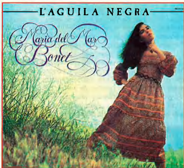
La Bonet i portada de 'Fotogramas'.