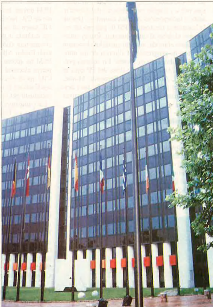
El Parlament europeu es renovarà el 12 de juny. A Espanya, però, les eleccions europees tenen una clau de política interna.

El dia 12 de juny escollirem els eurodiputats que ens representaran al Parlament europeu. Però també es decidiran moltes més coses.