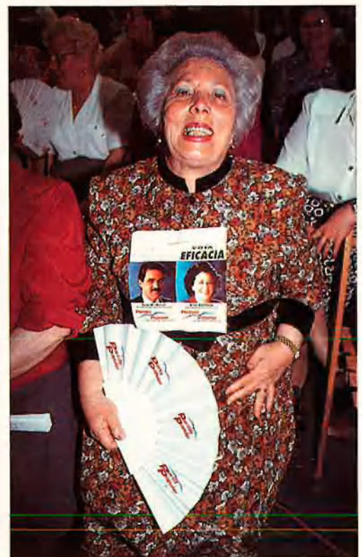
Tres mostres del ventall immaculat del Partit Popular.