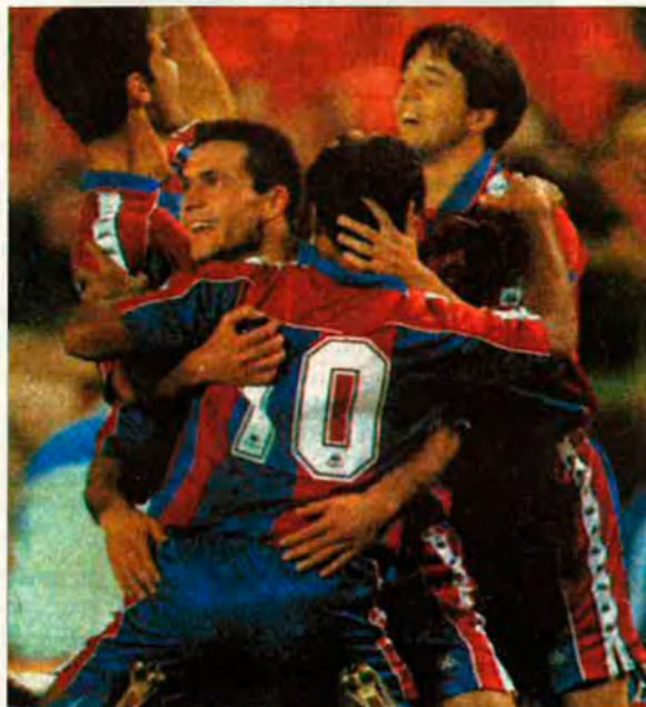
El Barça de Cruyff va guanyar, per fi, al Bernabeu. La reacció espanyola va ser ferotge.

El partit de Madrid ha anat agafant una transcendència que ni els més irreconciliables enemics de l'equip blanc —i violeta— podien esperar. Sembla ben bé que algú del sector més impacient d'Esquerra Republicana s'hagués infiltrat al departament d'esports de TV3. Si no, no s'entén com es va aconseguir aquella primorosa tria d'opinions de socis madridistes, gent aparentment adorable, que amb una sorprenent tranquil·litat treien del més profund del seu ésser tota la bilis anticatalana. Van fer infinitament més per la causa