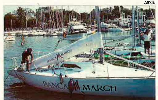
El port de Palma i l'estació de radar de Sóller cobren una gran importància.

L'OTAN fa aquests dies a la Mediterrània occidental les que són les seues majors maniobres navals dels darrers anys. En l'exercici Dynamic-Impact 94 participen forces d'onze països, que al seu torn es mouen coordinats amb un altre operatiu semblant que es fa a l'Atlàntic. Mallorca és un dels punts centrals de l'operació, ja que des del seu port partirà un grup de 30 vaixells, quatre d'ells portaavions, cap a un simulacre de desembarcament a Sardenya. Les instal·lacions de radar del Puig Major han estat també reforçades i renovades per a aquestes maniobres.