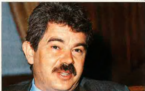
Pasqual Maragall. Havia pensat en Joan Clos com a possible substitut a l'alcaldia.

Pasqual Maragall ha comunicat a l'executiva del PSC que finalment ha decidit presentar-se a la reelecció. L'actual alcalde de Barcelona trenca així la incògnita sobre el seu futur polític immediat, incògnita que ell mateix havia plantejat. Però això no significa que Maragall descarte presentar-se a les autonòmiques del 96. En la mateixa reunió, l'alcalde va suggerir que el partit no designés el presidenciable socialista fins passades les municipals, i que, per tant la convenció prevista pel mes de setembre per designar-lo, només es limités a dissenyar el perfil del candidat.