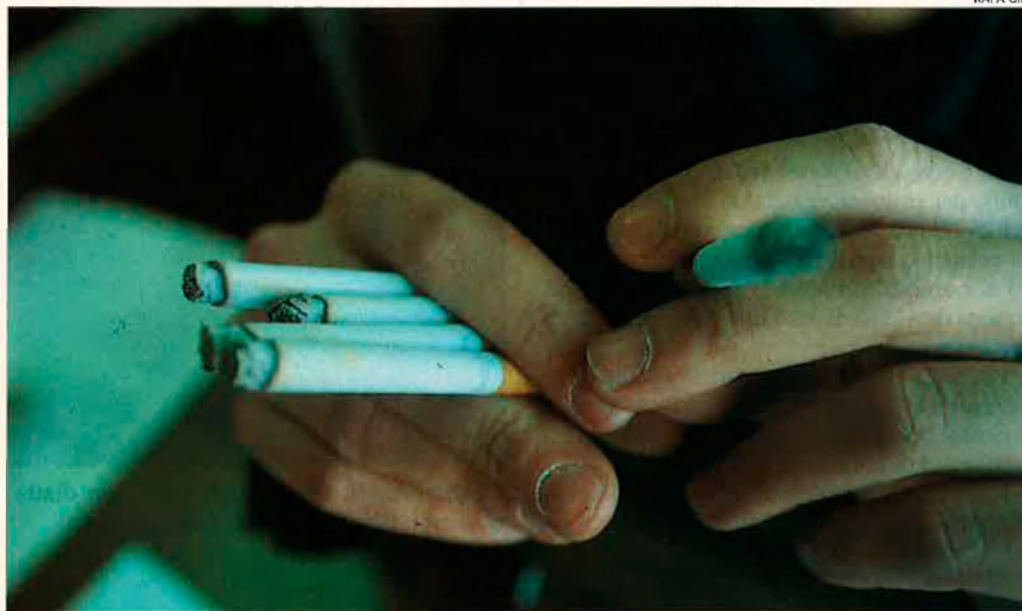
La discussió està en el paper addictiu de la nicotina i d'algunes substàncies més. I en el grau de perillositat del tabac també per als no-fumadors.