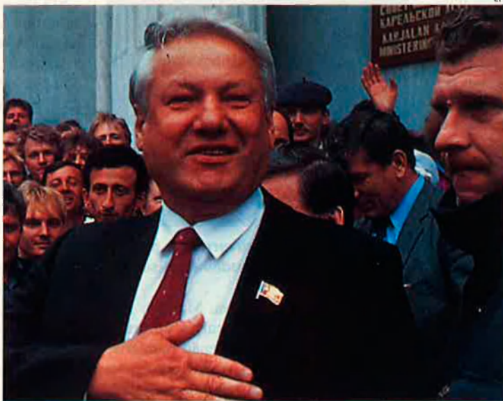
Borís Ieltsin. El president rus no ha estat el que se n'esperava.

Què se n'ha fet, d'aquell Ieltsin diputat-radical-opositor que va arribar fa quatre anys a l'aeroport de Barcelona, després d'un accidentat viatge des de