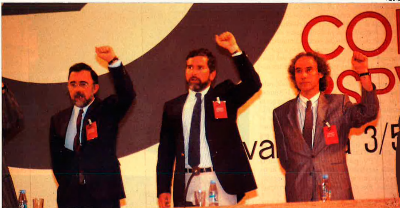
Antoni Garcia Miralles, Joan Lerma i Ciprià Ciscar en la cloenda del V congrés nacional del PSPV-PSOE en 1988. Formen la troica socialista des del III Congrés Nacional del PSPV-PSOE, fet a Benicàssim l'any 1982.