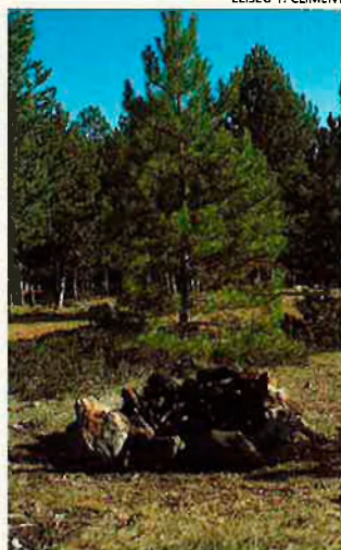
Foguera apagada en els pinars de Sant Joan del Penyagolosa. Centenars de rotgles de foc com aquest delaten la presència il·legals.

El cas del Penyagolosa deixa cua i resulta un tema delicat. Els esforços de la Conselleria de Medi Ambient s'han saldat fins a aquest moment amb la confecció d'un Pla