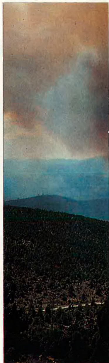
Incendi al terme del Castell de Vilamalefa. El front de foc avançava a ritme trepidant a causa de les fortes ràfegues de vent de ponent.

La campanya “Pasqua verda” intenta ser, preferentment, una campanya preventiva contra l'alt risc d'incendis i pretén evitar alhora l'acumulació de deixalles a les zones forestals, com a resultat del pas massiu de campistes. A banda, la Conselleria de Medi Ambient, a través d'aquesta iniciativa, pretén conscienciar i informar els visitants de les muntanyes amb la publicació d'unes normes com ara la prohibició d'encendre foc fora de les zones habilitades per a aquest efecte, la recol·lecció de flors i fruits de manera indiscriminada o evitar l'ús incorrecte dels vehicles a motor, entre altres.