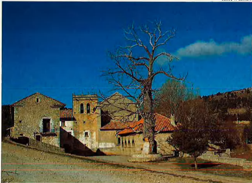
Santuari de Sant Joan del Penyagolosa. El santuari atrau cada cap de setmana centenars de visitants i excursionistes.

d'Ordenació de Recursos Naturals (PORN) que va quedar definitivament redactat l'any 1992, però els veïns dels municipis inclosos en la superfície que podria ser declarada paratge natural s'hi oposen rotundament.