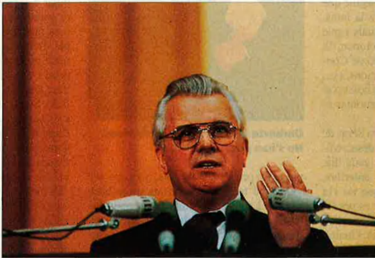
Leonid Kràvtxuk. El president volia devaluar les eleccions.

Si, a tot aquest panorama, hi afegim el malestar dels russos que viuen a Ucraïna —el 22% de la població— i els intents de Crimea de separar-se'n per establir lligams amb Moscou, el quadre resultant és el que vaticinava la CIA: un dels més perillosos de l'Europa de l'est. Llibert Ferri