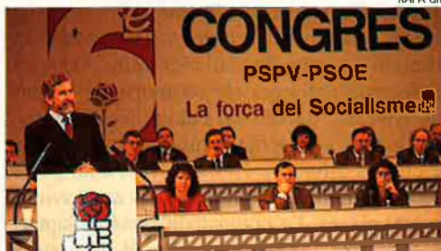
Congrés dels socialistes valencians. Les sigles del PSPV no havien faltat mai des de la unificació dels socialistes valencians.