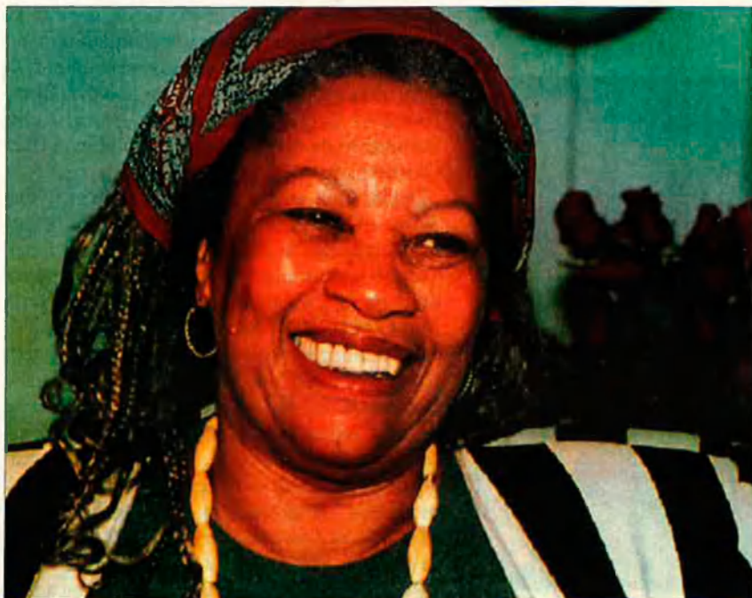
Spike Lee (dalt) i Toni Morrison. Els nord-americans de raça negra han tingut fins ara una presència testimonial en el món de les lletres i de les arts.

T ot i representar el 10% de la població dels Estats Units, els nord-americans de raça negra han tingut fins a la dècada dels 80 una presència quasi testimonial en el món de les lletres i de les arts. La seua aportació cultural des de començament de segle s'havia restringit exclusivament a la música popular. En realitat, quasi tots els ritmes moderns (jazz, blues, soul, funky, rap) tenen l'origen en els guetos negres de les grans ciutats o en les petites comunitats rurals del sud dels Estats Units, on una bona part de la població era de raça negra. Però, en altres activitats culturals, com literatura, cinema o arts plàstiques, els negres eren ignorats o simplement servien de referència costumista dels escriptors i cineastes blancs. Algunes de les grans figures del jazz (Billie Holiday, Luois Armstrong, Ethel Waters) que participaren en les produccions musicals de Hollywood dels 40 i 50 foren obligats a interpretar papers de cambriers o de servents perquè la censura i el gran públic difícilment acceptaven que els negres tingueren oficis més dignes en la ficció cinematogràfica.