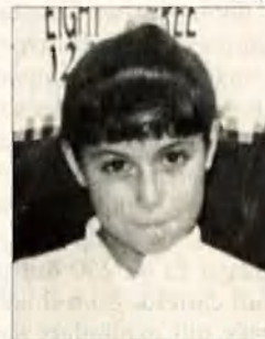
Les dues nenes assassinades.